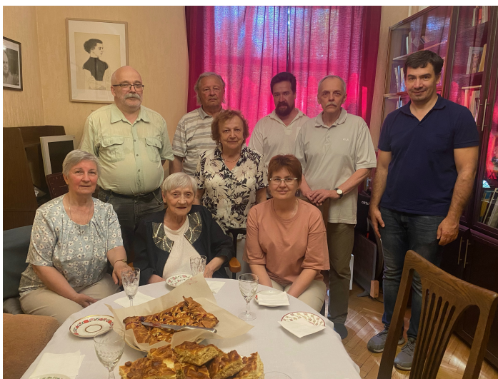
90-летие Н. Н. Уральцевой, 2024 год.

атмосферу, сочетающую теплые, дружеские отношения с высокой требовательностью. Эту атмосферу сотрудники стараются поддерживать и в наши дни.